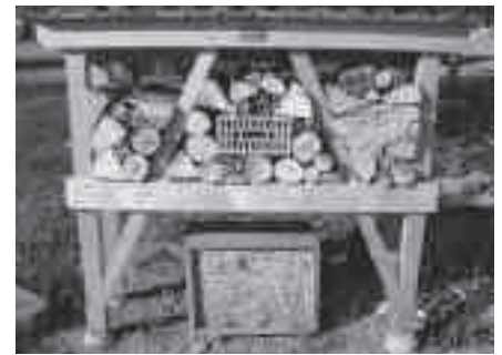
Wildbienen am Greifensee.

Die Führung findet am 27. März von 13.30 Uhr bis 16 Uhr statt. Der Treffpunkt ist um 13.30 Uhr am Eingang der Naturstation Silberweide. Eine Anmeldung ist für diese Führung nicht notwendig. Die Kosten belaufen sich auf den Eintrittspreis der Naturstation Silberweide.