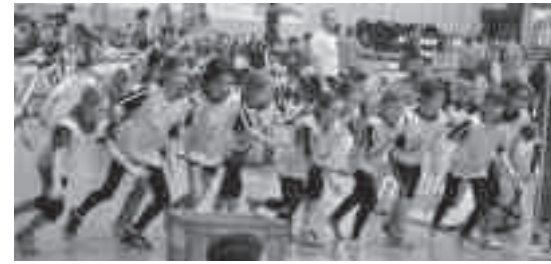
Die U12-Mädchen beim Start zum Biathlon.