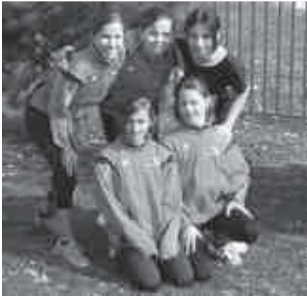
Das Maurmer U14-Team nach einem Wettkampf voll Ups und Downs.

Bereits die Anfahrt von Zürich bis nach Martigny, in den französischsprachigen Landesteil, war eine Aufregung und liess nun alle realisieren, dass es wirklich ein Schweizer Final ist. Der Druck auf die