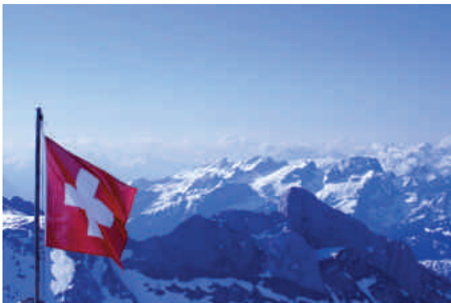
Begehrtes Land: Die Einbürgerungsgesuche steigen kontinuierlich.

Auch heute läuft der Einbürgerungsprozess nicht schneller, aber der Inspektionsbeamte ist weggefallen und das Prüfungsgespräch einfacher geworden. Geblieben ist das langwierige Einbürgerungsprozedere, da das Bürgerrecht gemeinsam vom Bund, dem Kanton und der Gemeinde vergeben wird und der Gesuchssteller zahlreiche Dokumente (Steuerbescheinigung, Strafregisterauszug, Lebenslauf, Wohnsitzbestätigungen usw.) einreichen muss. Das Bürgerrechtsgesetz verlangt nämlich, neben der wirtschaftlichen Selbsterhaltungsfähigkeit und dem unbescholtenen Ruf, gute Eingliederung in die Schweizer Verhältnisse sowie problemlose Verständigung in Deutsch. Dazu kommt die Bedingung, 12 Jahre in der Schweiz gewohnt zu haben, davon 2 Jahre in Maur. Zum Vergleich: in den Nachbarländern können ausländische Bürger je nach Land bereits nach vier, maximal acht Jahren die Staatsangehörigkeit erhalten. Ausländer,