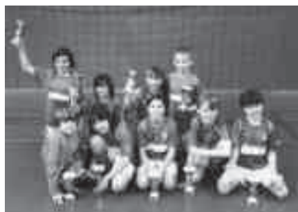
Pokalsieger vom Sonntag.

Nach siegreichem Samstag folgte der 2. Schlag! Am frühen Sonntagmorgen marschierten die E-Junioren der 1. Stärke-