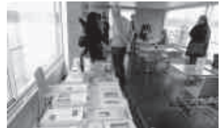
Reichhaltiges Buffet an Materialien zu Herrliberger und den Museen Maur auf dem Schiff.

stechers und Buchverlegers David Herrliberger (1697–1777) herangeführt werden. Die auch vor Ort auf dem Schiff anwesend gewesene Gilde Gutenberg konnte dem staunenden Laien ein Bild der Druckkunst von anno dazumal vermitteln. Die Besucher der Ausstellung konnten gleich frisch ab Druckpresse gelieferte Einladungen für die Museen Maur mitnehmen. Eine schöne Wochenendüberraschung.